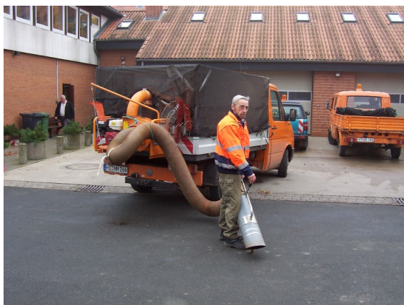
Laubsauger für den Pritschenwagen

Eine maschinelle Verbesserung erfolgte auch durch die Anschaffung des großen Laubsaugers für die Pritschenwagen und den Kauf eines Transportbeschickungsbandes für den winterlichen Salzeinsatz.