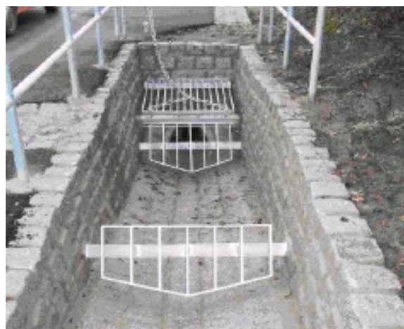
Rechen mit Vorrechen am Hopfenberg im OT Sack

Es wurde gleichzeitig ein entsprechendes Kataster über diese Einlaufbereiche erstellt und die Datenblätter den Einsatzkräften zur Verfügung gestellt.