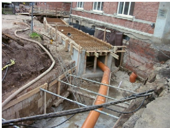
Verrohrung Dohnser Bach

Im Zuge einer Brückenhauptprüfung wurde die alte Verrohrung (19. Jahrhundert) des Dohnser Baches im Bereich "An der Vormasch" untersucht. Auf Grund des sehr schlechten bautechnischen Zustandes mussten im Zuge der Gefahrenabwehr Sofortmaßnahmen ergriffen werden. Zusammen mit den Anliegern wurde ein Großteil der Verrohrung im Jahr 2005 saniert. An den Kosten sind die direkten Anlieger beteiligt.